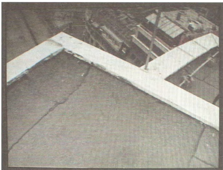
REMAKE, 2006. eksperimentalni dokumentarni film / an experimental documentary film, 92:00 min, betacam, boja/colour, ton/sound kamera/camera: Miodrag Milošević montaža/editing: Boško Prostran izvršni producent/executive producer: Aleksandra Sekulić asistent produkcije/production assistant: Ivko Šešić Dom kulture Studentski grad, Akademijski kino klub, Beograd